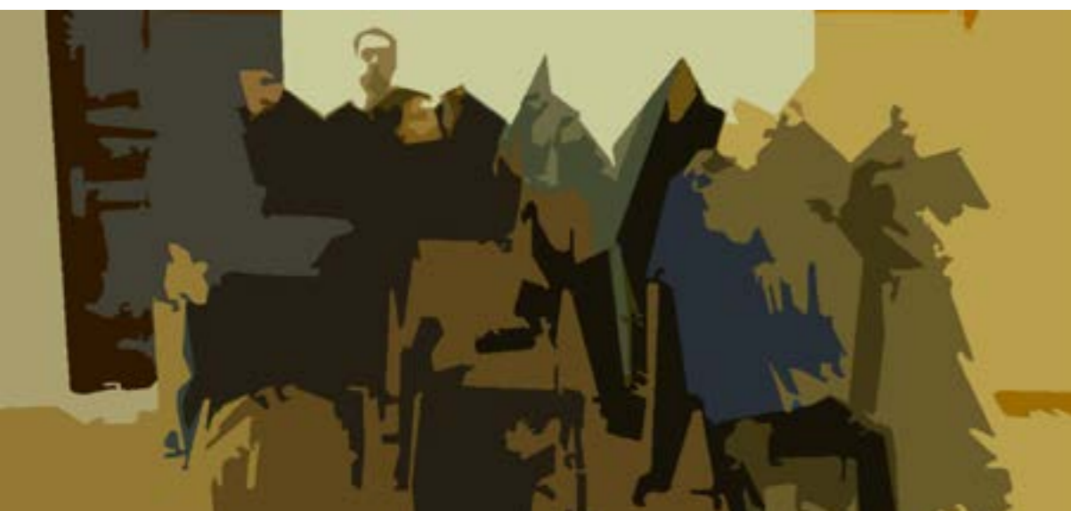
« Mon petit oiseau »